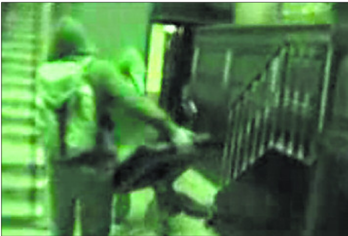
LA 'ACCIÓN' DE LOS CUATRO GATOS EN EL CONGRESO. Las imágenes muestran tres momentos de la supuesta incursión de los jóvenes en el Congreso, el documento que dejaron en el escaño y el momento en el que roban la silla de Zapatero en el hemiciclo.

do la sede de la soberanía popular está vacía. Pero el hemiciclo aparece iluminado, con papeles aún sobre los escaños, lo que indica que la escena del robo físico de la silla pudo ser grabada tras un pleno o tras una jornada de puertas abiertas.